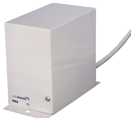
PA8 – Spjällmotor.

Kontakta service; felrapport kan lämnas av behörig driftstekniker via Lindinvent's hemsida: www.lindinvent.se