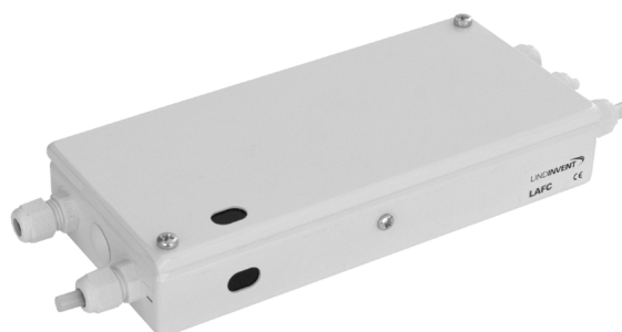
L AFC – LAF-bänksregulator.