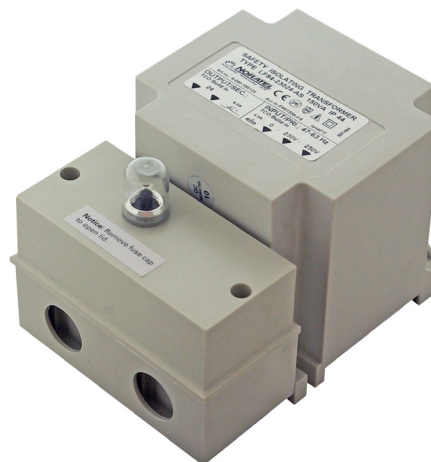
LF084B – 230 till 24V transformator för fast montage.

7 A sekundärt överströmsskydd, återställbart utifrån via tryckknapp.