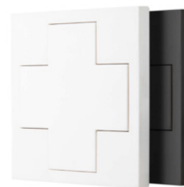
DSC – Fyrvägsbrytare DALI.