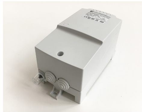
Transformator för väggmontage PVS144A.

Tillhandahåller 24 VAC matningsspänning.