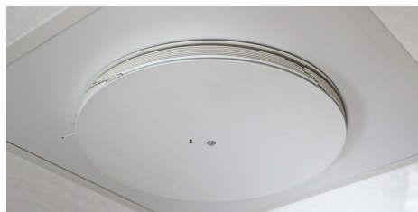
Ett aktivt taktilluftsdon monterat med undertaksplåt UTD i undertakets bärverk.

Täckplatta UTD används tillsammans med monteringsskenan UTB i undertak för att montera ett tilluftsdon. Mått i mm.